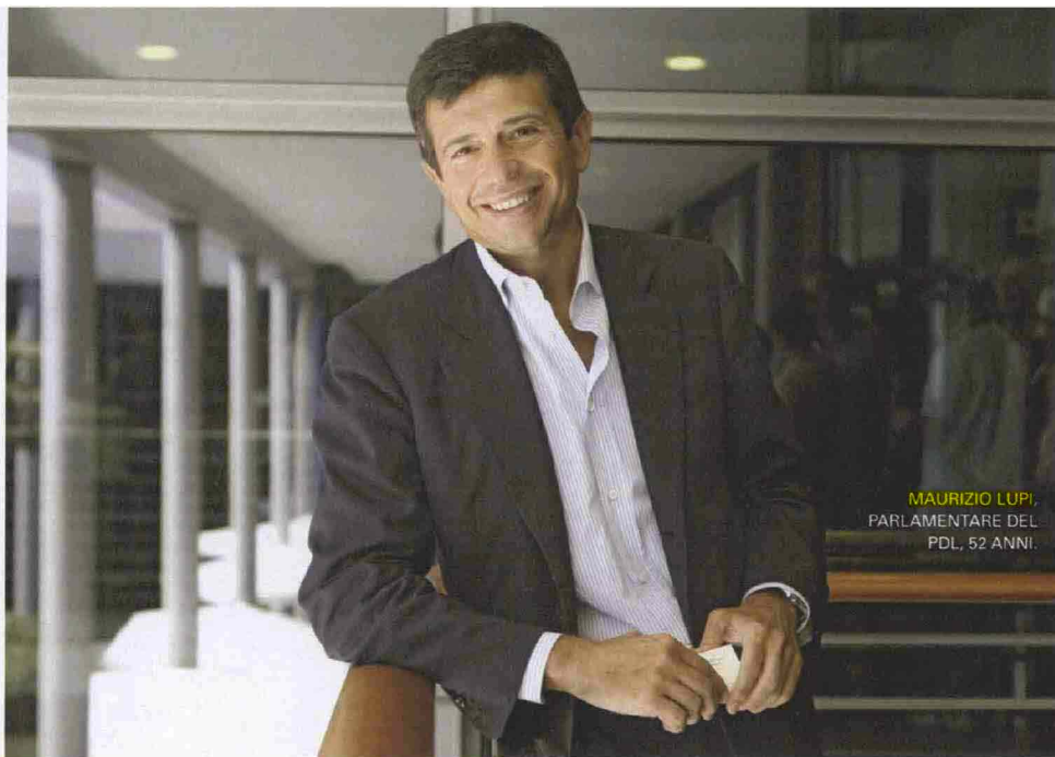
MAURIZIO LUPI, PARLAMENTARE DEL PDL, 52 ANNI.