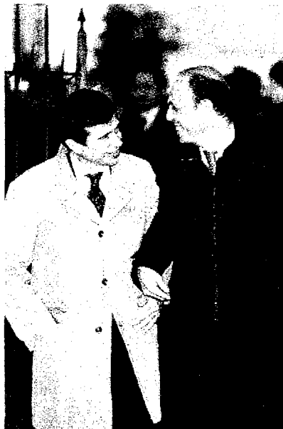
I vertici Angelino Alfano e Maurizio Lupi al termine dell'ufficio di presidenza

I timori Maggioranza preoccupata per i riflessi del braccio di ferro con il Capo dello Stato