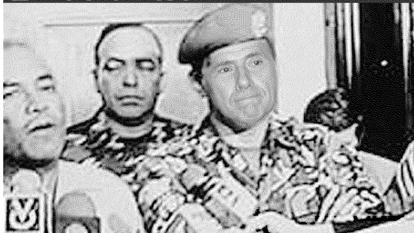
SUL BLOG DI TONINO Il volto di un militare sostituito con quello di Berlusconi

Ritaglio stampa ad uso esclusivo del destinatario, non riproducibile.