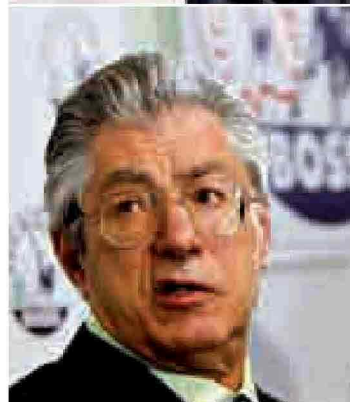
In alto, il presidente della Lombardia Formigoni, che ha duramente criticato i tagli alle Regioni imposti dalla Finanziaria di Tremonti. Al centro, il premier Berlusconi, sempre più attentato da un riavvicinamento all'Udc di Casini, che però metterebbe a rischio l'alleanza di governo con la Lega di Bossi (a lato)