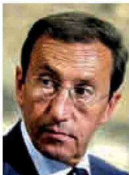
Da sinistra, il leader dell'Udc Pierferdinando Casini; il coordinatore del Pdl Denis Verdini e il presidente della Camera Gianfranco Fini

Lupi «Occorre ripetere per l'ennesima volta che alternative a Berlusconi non ce ne sono e senza la leadership di Berlusconi non esisterebbe più neanche il centrodestra?»